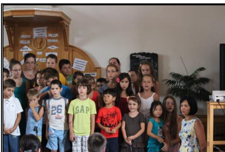
Minden napra kell egy kulcs Gyerektábor 2015