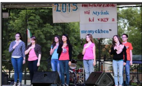
Nézz fel! Keresztény Fesztivál 2015

20 év történelem bizonyágtételekkel tarkítva! Megjelent a Lámpás 75 száma egy kötetben.