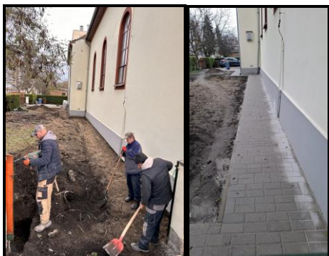
A templom fala melletti járda felújítás alatt és kész állapotban